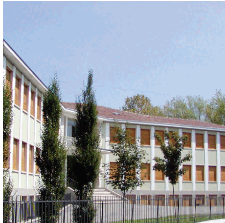
La scuola elementare

Negli ultimi tempi si parla molto di sicurezza scolastica ed i noti eventi luttuosi accaduti in Molise hanno certamente contribuito a portare alla ribalta ancora una volta questo importante problema. L'Amministrazione comunale si è sempre attivata per garantire il persistere delle condizioni di sicurezza nelle proprie strutture finanziando ogni anno interventi manutentivi e di verifica, ma quest'anno ha deciso di fare ancora di più: tutti gli edifici scolastici sono stati sottoposti ad una sorta di accurato check-up: l'asilo nido e la scuola materna statale, le scuole elementari del capoluogo e di Borghetto, la scuola media "B. Pelacani". Questo è stato l'argomento affrontato nel corso