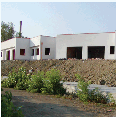
Nuovo Asilo Nido